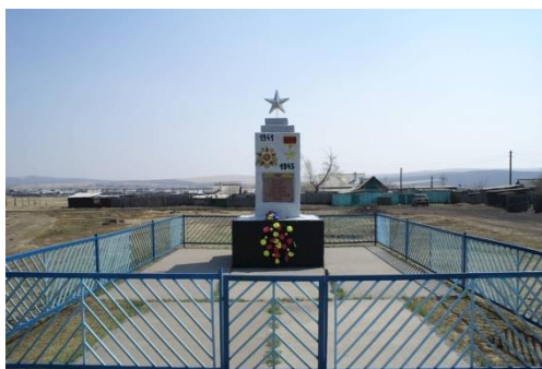
ст. Мирная Забайкальский край