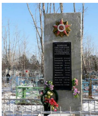
г. Нерчинск Забайкальский край. Братская могила советских воинов, умерших в эвакуационном госпитале № 1478