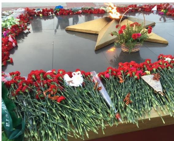
г. Чита Вечный огонь