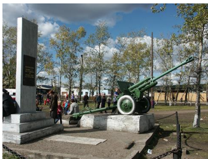
с. Линево Озеро Забайкальский край